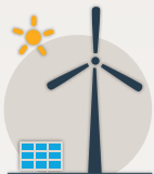
Halumajut auladjutikhat havaakhat