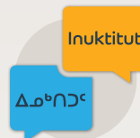
Pitquhirmik imaalu uqauhirmik pinahuarutikhat