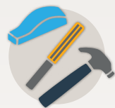
Hanaugangnirmik imaalu ulapqidjutit hulipkaidjutikhat