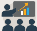
Ajuiqhaqtakhat imiaalu nauvalliadjutikhanut ikajuutikhainik pinahuarutikhat